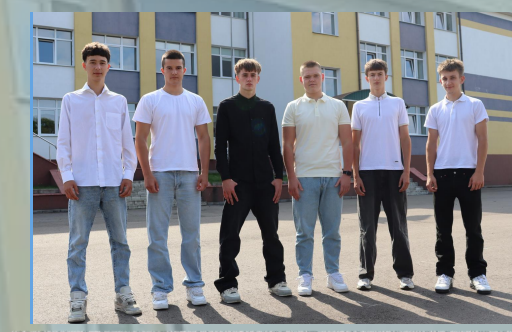
Дружина юних пожежників