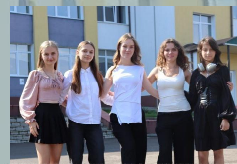
Відділ з питань екології