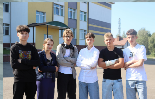
Відділ охорони правопорядку