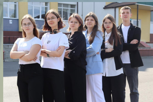
Відділ з питань освіти