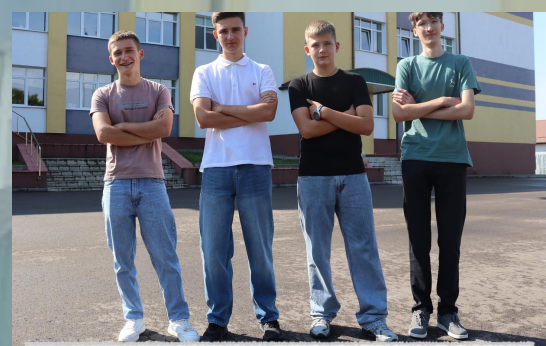
Відділ національ- патріотичного виховання